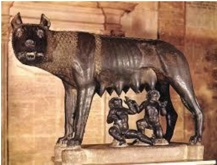
Romulus és Remus