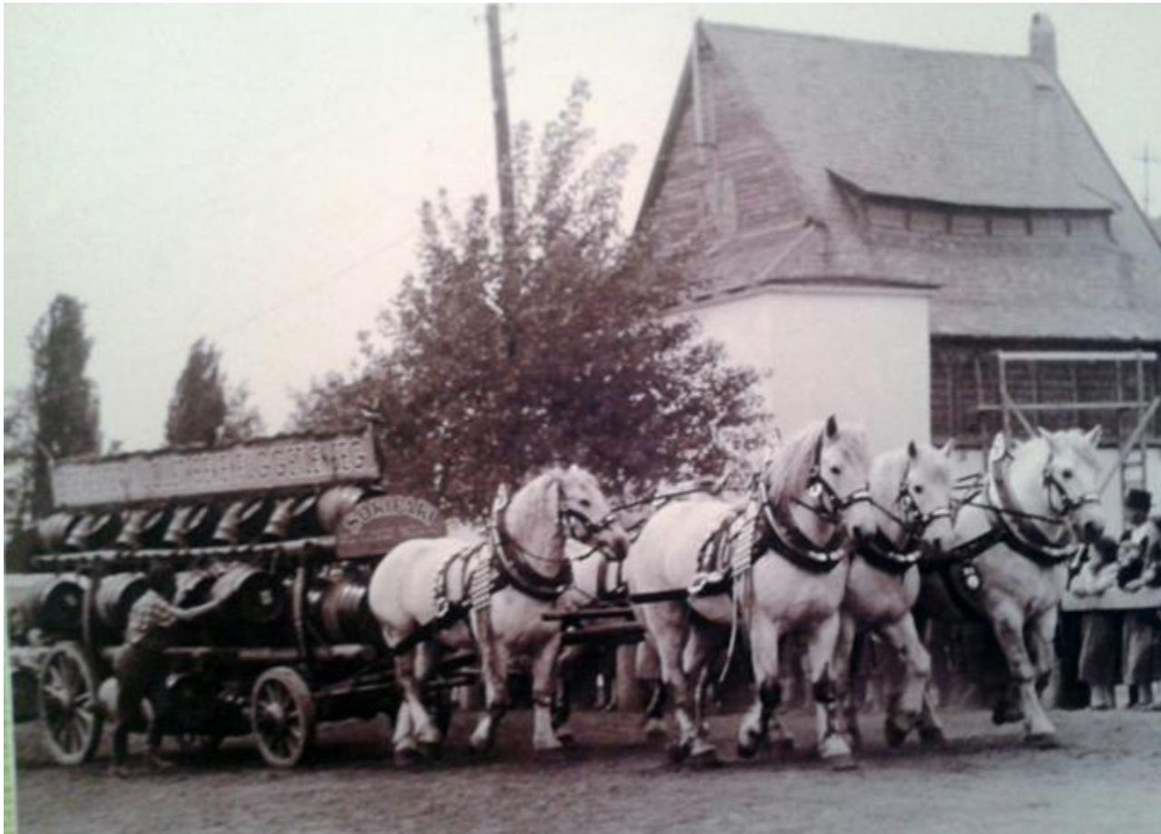
A sörös lovak még mindig dolgoznak